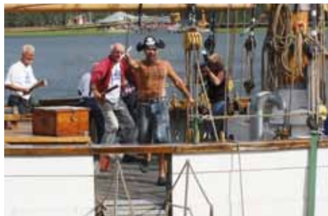
Torsödagarna 2010, pirater på Mina.

Barnen får träffa kalvar och andra djur. Torsö Hembygdsgörelse serverar kaffe med dopp, våfflor och glass