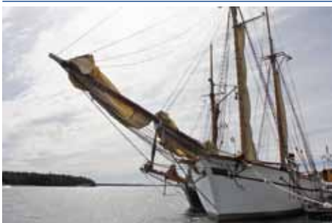
Vänergaleasen Mina i Brommösund.

Kom ombord på Vänergaleasen Mina, ett av världens äldsta segelfartyg. Byggt 1876 på stranden vid Fågelö gård. Mina ligger vid Brommö magasin.