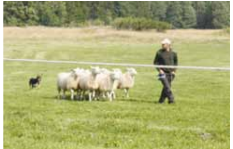
Fårvallning vid Fågellä gård.