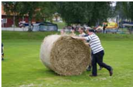
Mångkamp i bondepraktik.